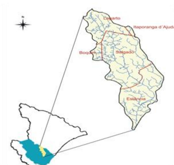
Figura 1. Representação espacial da bacia hidrográfica do rio Piauitinga e sua localização geográfica no estado de Sergipe (SERGIPE, 2004).