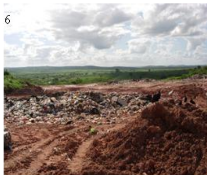
Figuras 5 e 6: Lixão no município de Lagarto/SE. Fonte: Arquivo pessoal da pesquisa em campo em 04.2010.